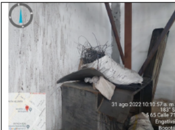
Fotografía No 7. Material dañado que pasa a la molienda