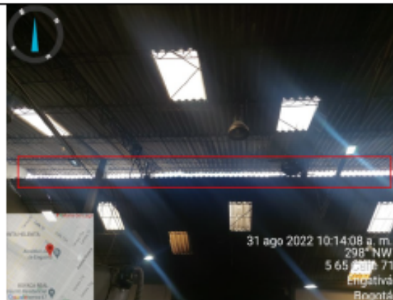
Fotografía No 10. Espacio entre tejas – área sin confinar