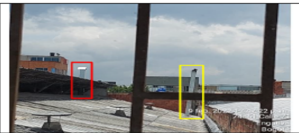
Fotografía No 8. Ductos y puntos de descarga de la peletizadora (rojo) y hornilla (amarillo)