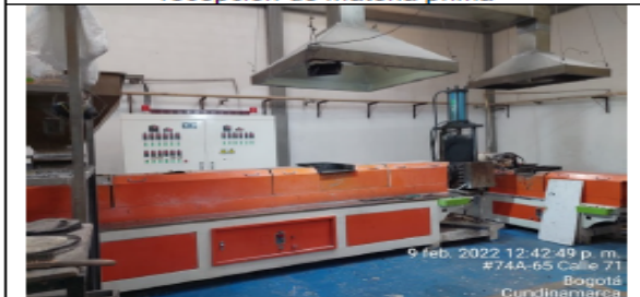
Fotografía No 5. Peletizadora y sistemas de extracción