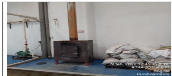
Fotografía No 7. Hornilla quema mallas