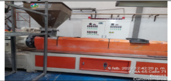
Fotografía No 4. Mezcladora y peletizadora