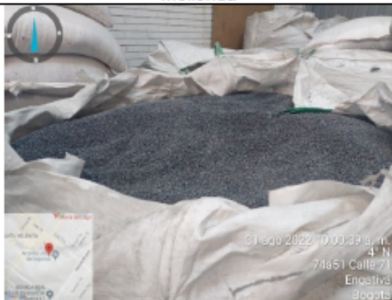
Fotografía No 9. Material terminado – Pellets