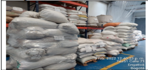
Fotografía No 3. Área de almacenamiento y recepción de materia prima