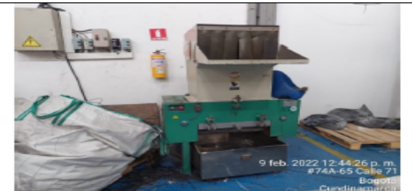
Fotografía No 6. Molino