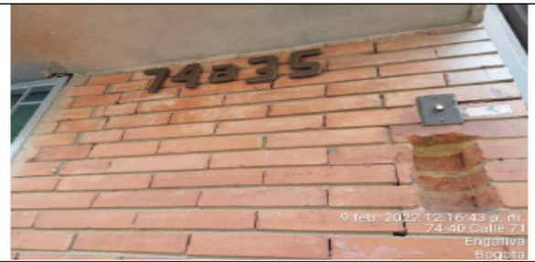
Fotografía No 2. Nomenclatura Urbana