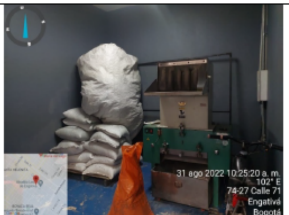
Fotografía No 8. Molino