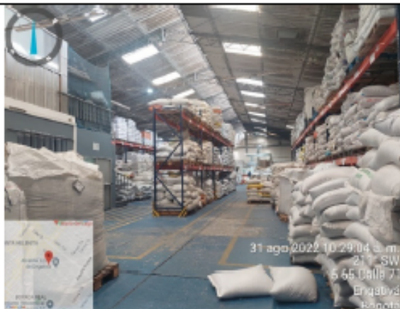
Fotografía No 11. Vista general del área de producción