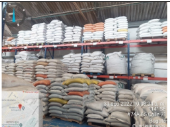
Fotografía No 12. Área de almacenamiento